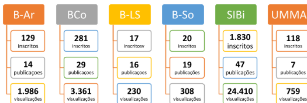
Figura 2 – Números referentes aos canais do YouTube